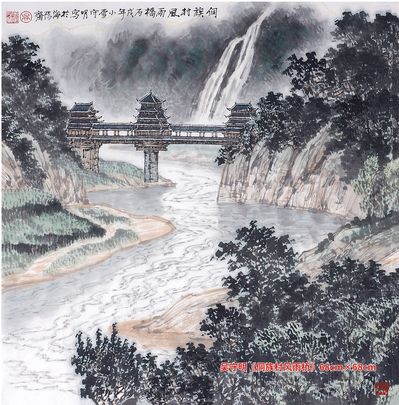
吴守明 《侗族村风雨桥》 68cm×68cm