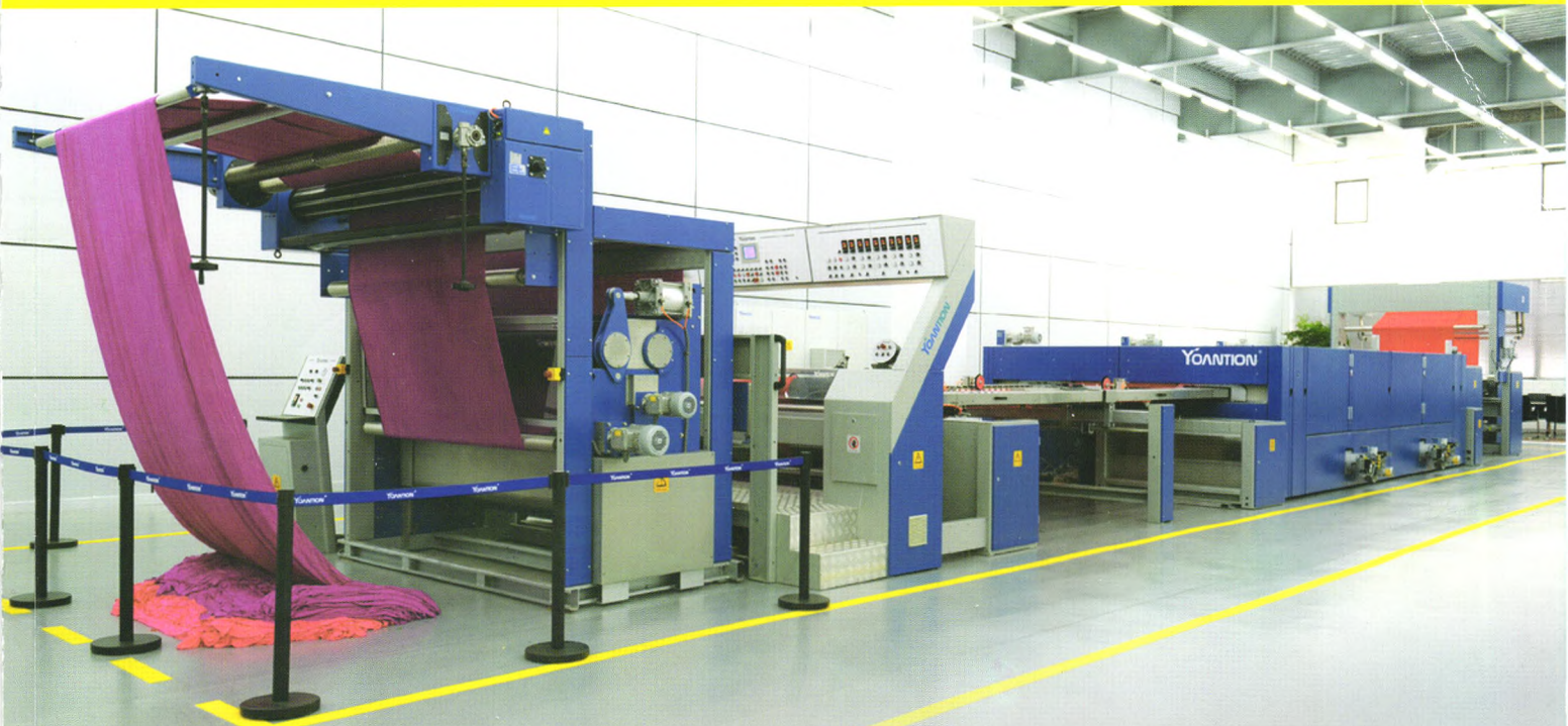
第五代节能环保热风拉幅定形机 The 5th Generation Saving Tentering And Heat-treatment Machinery