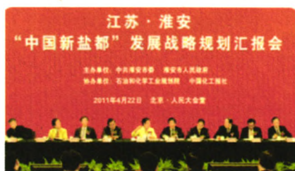
淮安地下岩盐储量全国第一