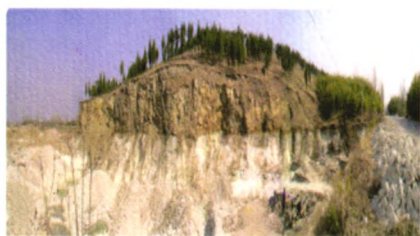
淮安凹土资源储量占全国 70%，占世界 49%