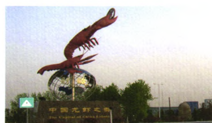
龙虾之都，丰富的农林水产资源