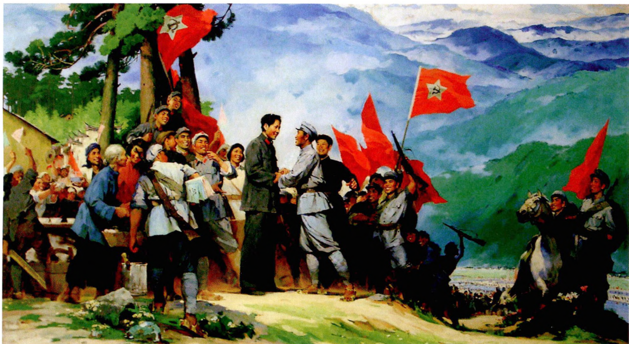
P16 《井冈山会师》，1975年，林岗，油画，纵200厘米，横380厘米，现藏中国国家博物馆。该画描绘了1928年4月28日，朱德等率南昌起义部队与毛泽东领导的队伍在井冈山会师的场景，在小说《日出东方》结尾，作者充满激情地写道：“两双大手如山峦相连一样，又紧紧地握在了一起”