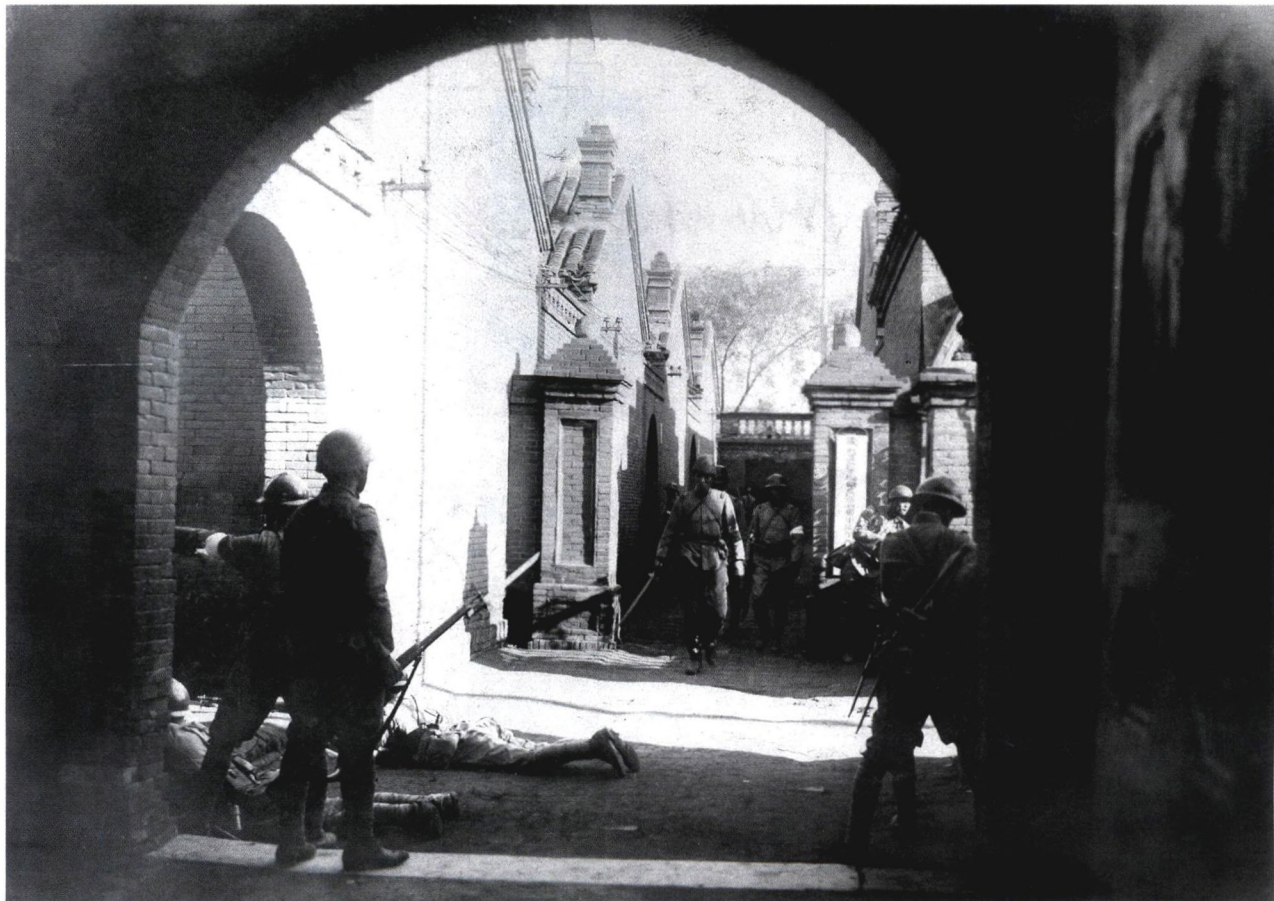
P20 日本士兵在九一八事变中占领沈阳东北边防军公署，摄于1931年9月19日。九一八事变标志着日本帝国主义侵华战争的开始，从1931年九一八事变到1945年日本投降，经过14年的浴血奋战，中国人民才获得抗日战争的最终胜利