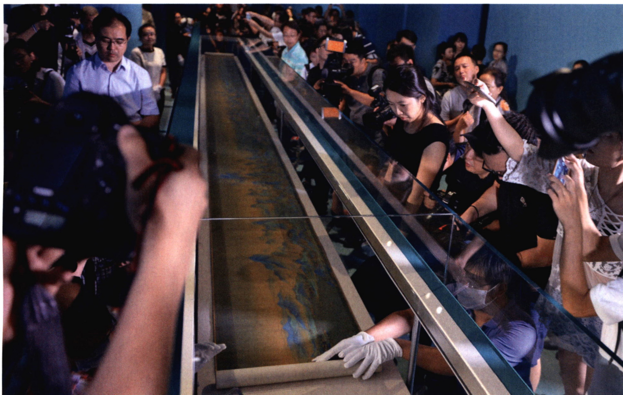
P06 2017年,王希孟《千里江山图》在故宫布展时的场景。《千里江山图》卷为北宋王希孟所绘,绢本设色,纵51.5厘米,横1191.5厘米,现藏故宫博物院,收录于《第二批禁止出国(境)展览文物目录》。该画为王希孟传世唯一作品,以概括精练的手法、绚丽的色彩和工细的笔致被视为宋代山水画杰作