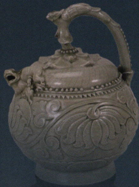
耀州窑青釉刻花提梁倒流壶