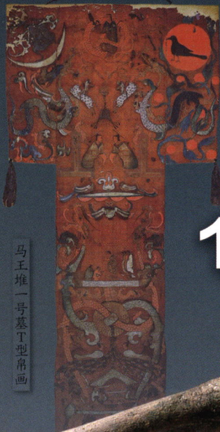
马王堆一号墓T型帛画