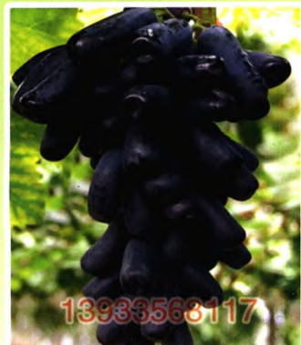
甜蜜蓝宝石（晚熟） 从澳大利亚直接引进