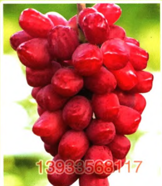
浪漫红颜（晚熟） 在南方雨季能着全色稀有品种