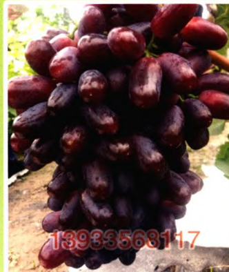
巨胜一号（特早熟） 特早熟具有发展潜力的品种