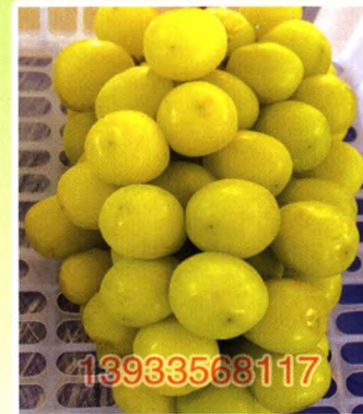
阳光玫瑰（晚熟） 有独特的玫瑰香味，可无核化处理

早熟品种：绍兴一号、春光、蜜光、早霞玫瑰、早峰、夏黑、早夏黑、红巴拉多、黑巴拉多、七星女皇、新郁、里扎马特、晨香、早生内玛斯、夏至红、8611、8612、维多利亚等 中晚熟品种：巨玫瑰、甬优一号、金手指、比昂扣、藤稔、味道、红乳、玲珑指、魏可、宝光、脆光、熊宝等 无核品种：火焰无核、红宝石无核、紫脆无核、紫甜无核、夏黑无核、夏日阳光、克伦生无核、无核白鸡心、碧香无核等 酿酒品种：赤霞珠、梅鹿辄、西拉、黑比诺、霞多丽、威尔多等