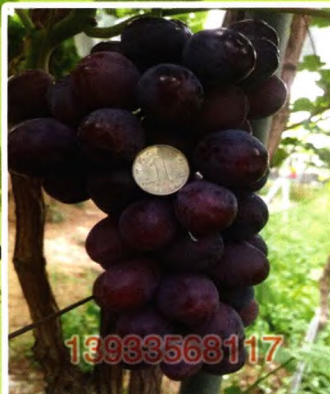
卓越玫瑰（早熟无核） 玫瑰香味葡萄品种