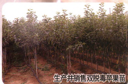
生产并销售穴盘脱毒砧木苗