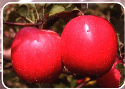
长枝型 神富8（神富一号）