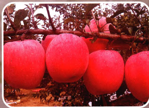
短枝型 神富6号（懒富）