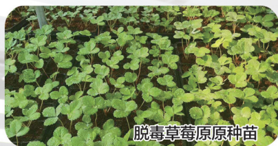
脱毒草莓原原种苗