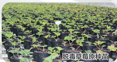
脱毒草莓原原种苗