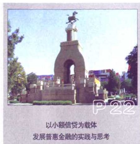
以小额信贷为载体 发展普惠金融的实践与思考