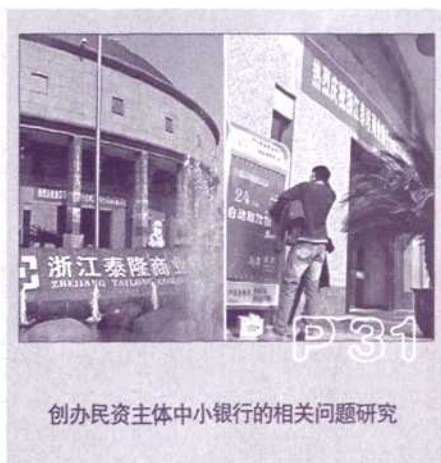
创办民资主体中小银行的相关问题研究