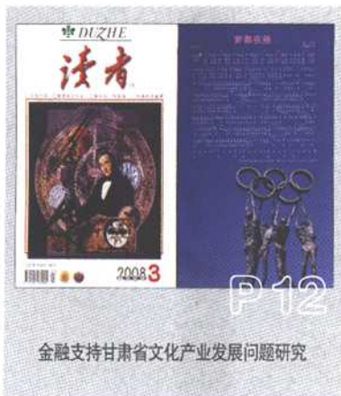
金融支持甘肃省文化产业发展问题研究