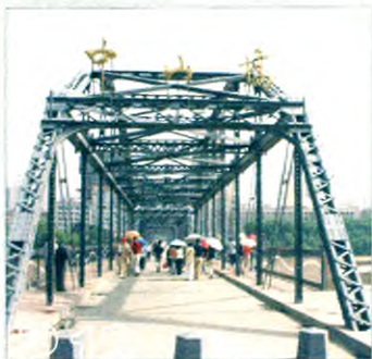
甘肃省经济转型跨越的金融支持