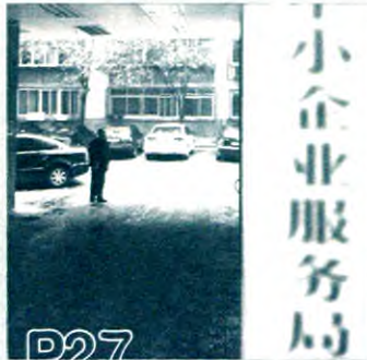
破解小微企业融资困境的监管路径探讨