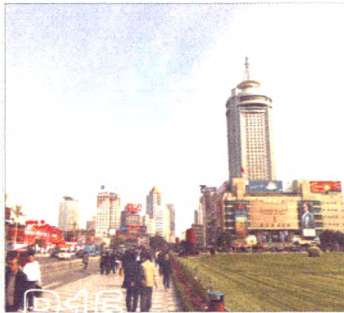
把握服务实体经济本质要求 全力推动甘肃转型跨越发展