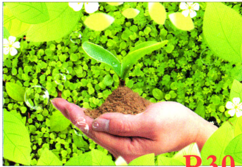
金融发展与环境保护协调机制研究