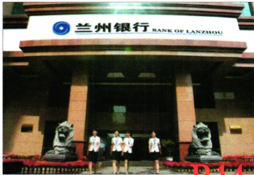
兰州银行开展小微企业信贷业务的思考