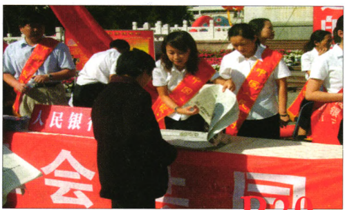
征信机制下对中小企业融资信用管理问题的思考