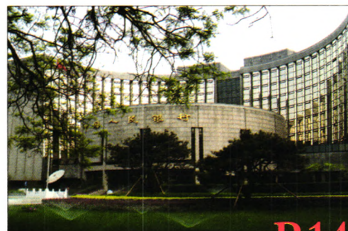
推进央行执法检查工作的 实践与思考