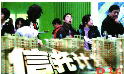
房地产信托产品在中国的创新性探讨