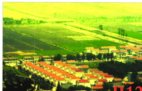
关于低碳乡村内涵与外延的研究