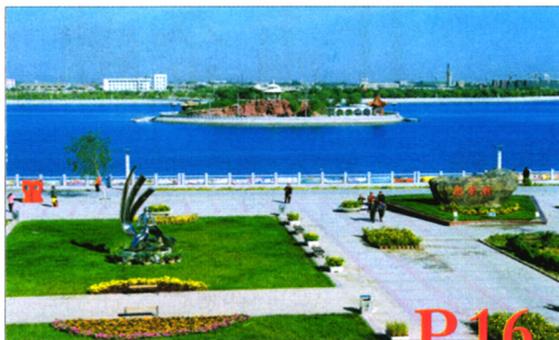
资源型城市工业反哺农业、农村的经验与启示