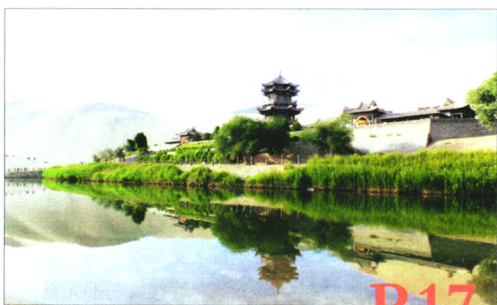
对华夏文明传承创新区建设 融资发展情况的调查与思考