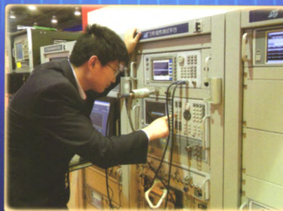
组建自动测试系统