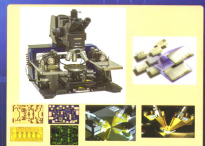
在片测试解决方案