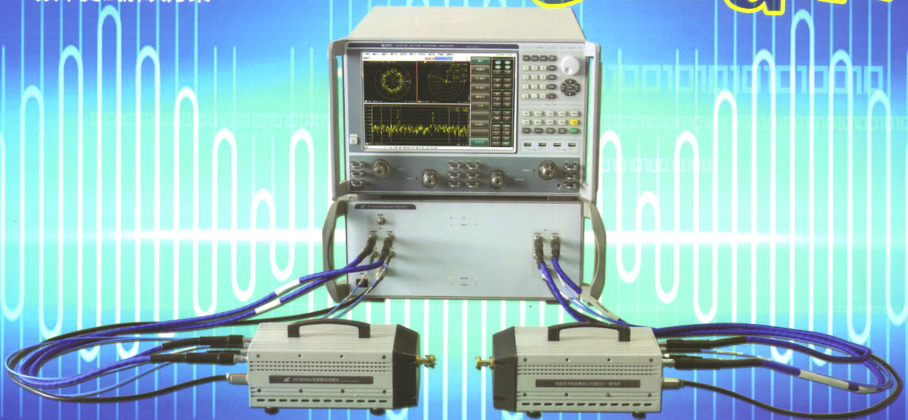
AV3672B 矢量网络分析仪 (扩展频率可达500GHz)