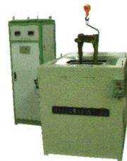
XGT-A型车钩零件(尾框)磁粉探伤机