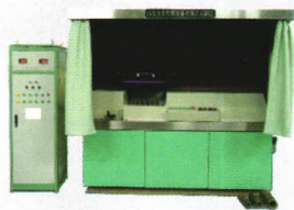
JWT-A型弹簧磁粉探伤机