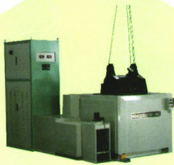
XJD-A型旋转磁场井式多功能探伤机