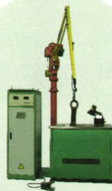
XJD-B型旋转磁场井式连杆探伤机