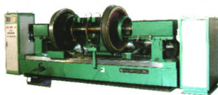
JZD-B型组合式机车轮对磁粉探伤机