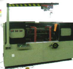
JWD-A型杆轴类零件(客车悬吊件)探伤机