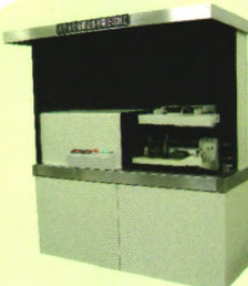
XWD-A型旋转磁场床式小件探伤机