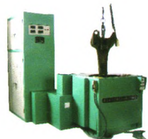
XGT-A型旋转磁场车钩零件探伤机