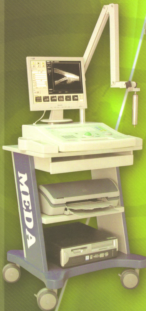
BME-300W 眼科超声生物显微镜 国食药监械(准)字2005第3231009号