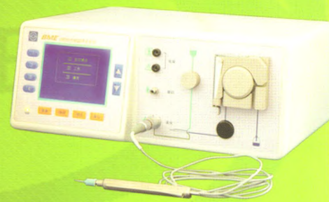
BME-280 白内障超声乳化仪 国食药监械(准)字2005第3231377号