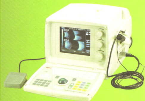
ODM-2100S 眼科A/B超 国食药监械(准)字2005第3231387号

地址: 天津市华苑产业区鑫茂科技园C2座3层D单元 邮编: 300384 电话: 022-83713808 83713889 传真: 022-83713880 网址: http://www.MEDA.com.cn 电子邮件: market@meda.com