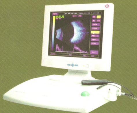
ODM-2200 眼科A/B超 国食药监械(准)字2005第3231387号