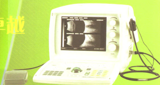
ODM-2100 眼科A/B超 国食药监械(准)字2005第3231387号