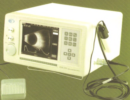
ODM-2000 眼科A/B超 国食药监械(准)字2005第3231387号