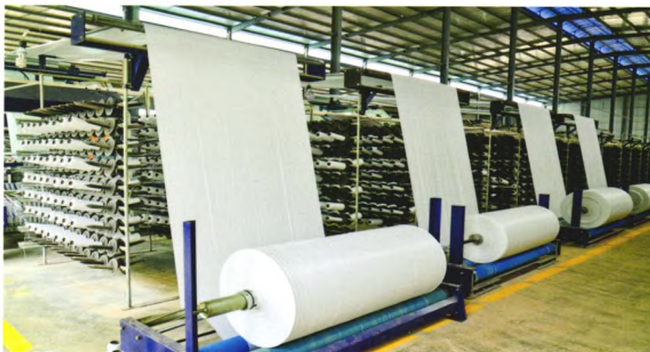
以碳酸钙为原料生产编织袋