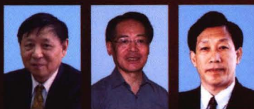
范滇元 院士 庄松林 院士 姜会林 院士