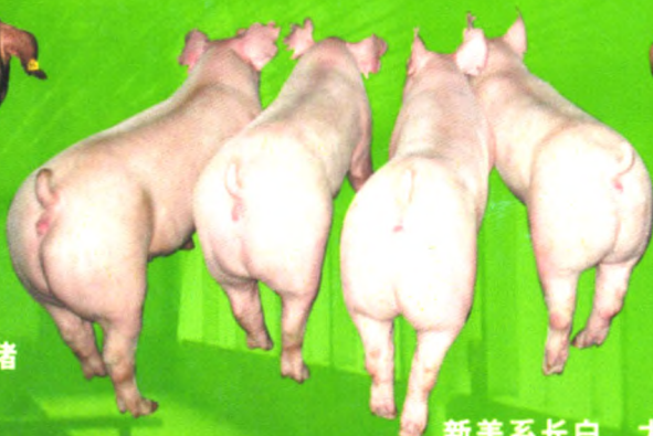
新美系长白、大约克母猪