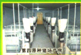
第四原种猪场产房