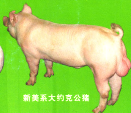
新美系大约克公猪