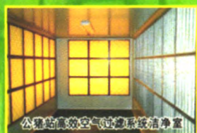
公猪站高效空气过滤系统洁净室