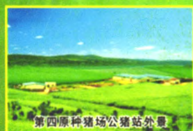
第四原种猪场公猪站外景