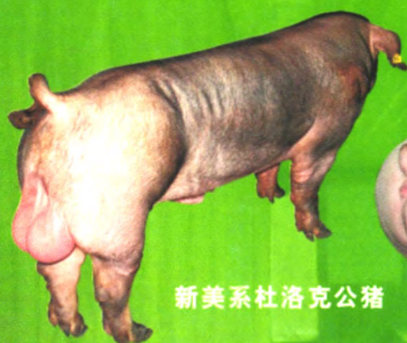
新美系杜洛克公猪