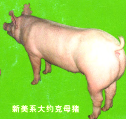
新美系大约克母猪