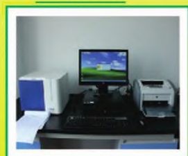
法国梅里埃ATD微生物定量仪: 微生物理化鉴定及药敏试验