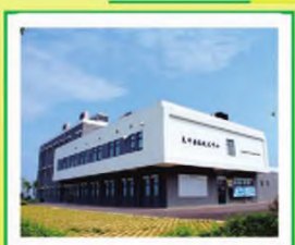
良圻兽医技术中心

第五原种猪场采用钢结构大跨度、全漏缝免冲水、全环境控制、全程空气过滤、全密闭连廊衔接等工艺, 结合严密的五级生物安全措施, 标准化生产流程, 快速、准确的实验室检测方法, 生产猪瘟、猪伪狂犬阴性, 猪蓝耳病双阴性健康种猪。