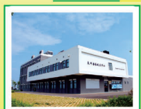
良圻兽医技术中心

第五原种猪场采用钢结构大跨度、全漏缝免冲水、全环境控制、全程空气过滤、全密闭连廊衔接等工艺, 结合严密的五级生物安全措施, 标准化生产流程, 快速、准确的实验室检测方法, 生产猪瘟、猪伪狂犬阴性, 猪蓝耳病双阴性健康种猪。