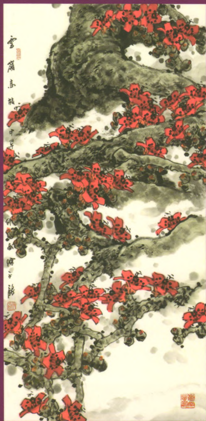
云岭高枝 138 × 69cm 2014年