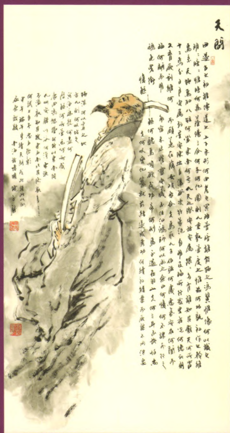
天问 150 × 82cm 2014年