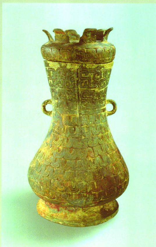
青铜圆壶（春秋时期） 1995年山东长清仙人台遗址出土