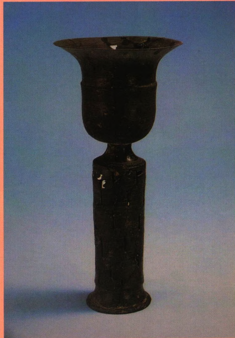
陶高柄杯（龙山文化时期）