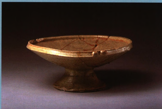
原始青瓷豆（西周早期） 临淄齐故城河崖头村出土