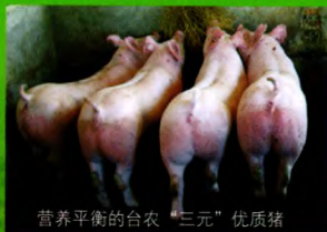
营养平衡的台农“三元”优质猪