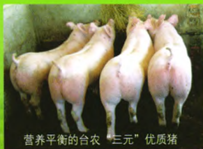
营养平衡的台农“三元”优质猪