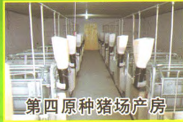
第四原种猪场产房