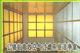
公猪站高效空气过滤系统洁净室