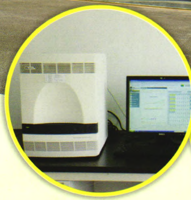
ABI荧光定量PCR仪：分子生物学检测（病毒分型、定量）