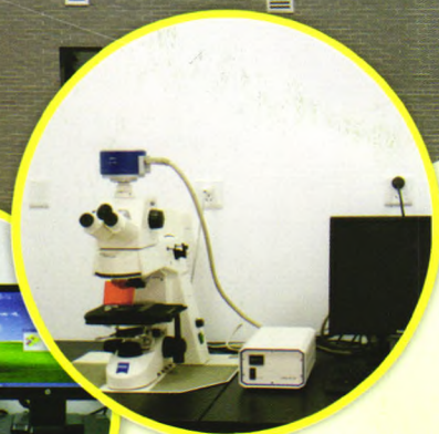
蔡司荧光显微镜：病理诊断（切片的观察）