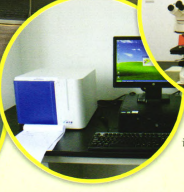
法国梅里埃ATB微生物鉴定仪：微生物理化鉴定及药敏试验