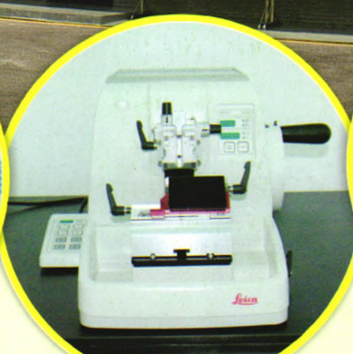
Leica石蜡切片机：病理组织切片