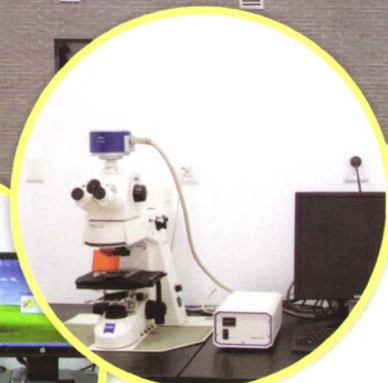
蔡司荧光显微镜：病理诊断（切片的观察）