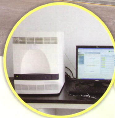
ABI荧光定量PCR仪：分子生物学检测（病毒分型、定量）