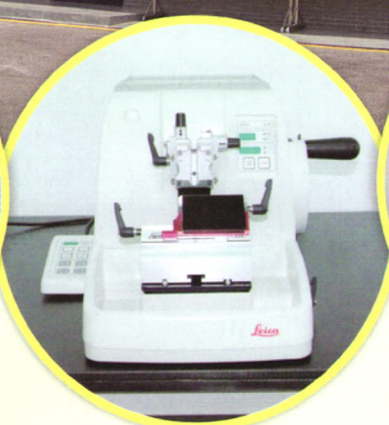
Leica石蜡切片机：病理组织切片