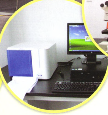
法国梅里埃ATB微生物鉴定仪：微生物理化鉴定及药敏试验