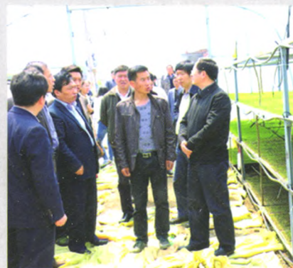
市领导视察指导合作社工作