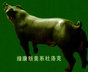
绿康新美系杜洛克