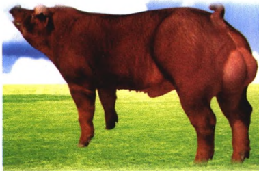
新美系杜洛克种猪