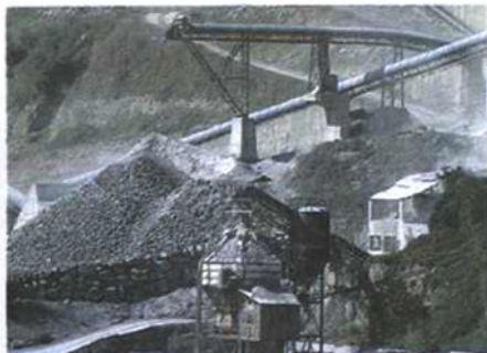
P48. 采煤区环境影响评价怎么做？ ——以重庆市武隆县沙子沱煤矿为例

2010已近尾声，中国环保也即将走完“十一五”的最后一年。在这一年之中，环境保护经历了许多事，或使我们欣慰、鼓舞，或使我们震惊、失落。时间是一架真正匀速的“永动机”，从不因我们怀念什么，就刻意停留，也不因我们厌恶什么，就加速流走。但尽管如此，我们还是应该在一定的时候回一下头，看看走过的路，记住曾经的足迹。因为没有过去，就无所谓未来。