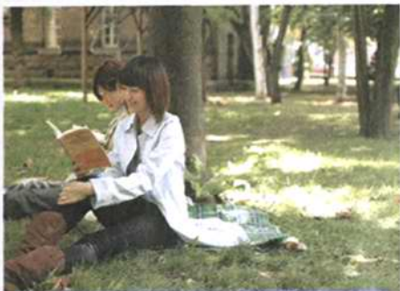
P66 马鞍山：让环保理念植根于校园