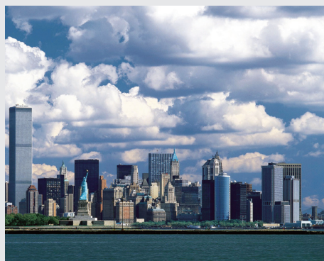
P25 国外大气污染防治的区域协调机制