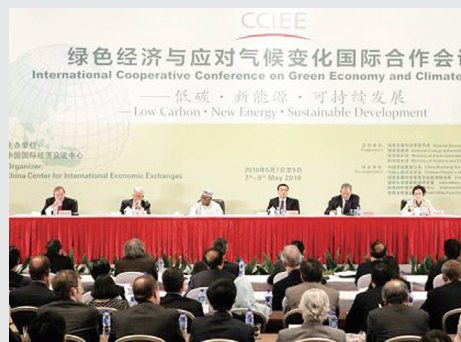
P8 李克强：推动绿色发展 促进世界经济健康发展