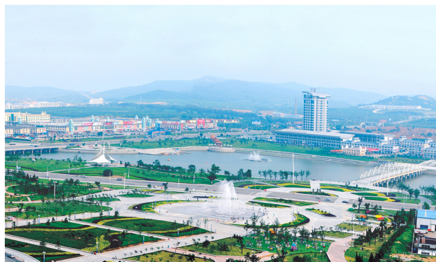
P56 文登四大体系打造生态新城