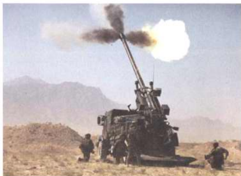
P43 应对常规战争的环境“罪过”