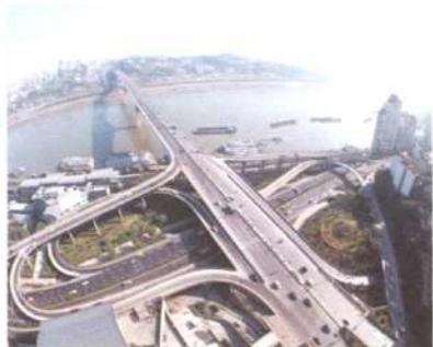
P28 “代价”中国亟需“创新”与“平衡”

每一起环境公益诉讼案例的出现和新的进展都如石子投湖，旋即引发持久而热烈的讨论。这固然反映了社会各界对环境公益的关心和支持，却也真实地折射出我国环境公益诉讼才刚刚蹒跚起步的现实。