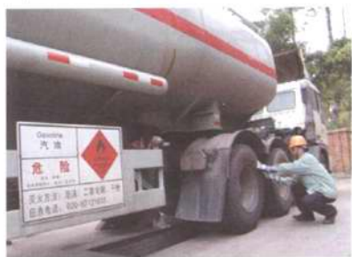
P40 危化品运输当警钟长鸣 ——三起交通事故引发氰化钠污染案的启示