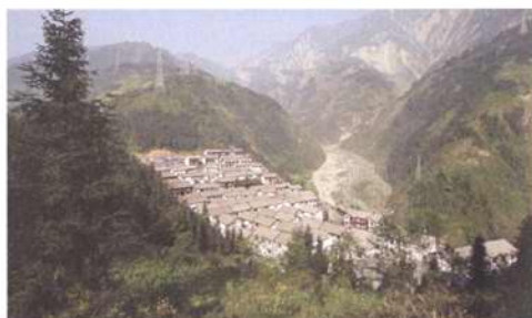
P50 四川：灾后三年演绎凤凰涅槃