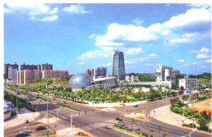
28. 重金属污染治理的湖南范本