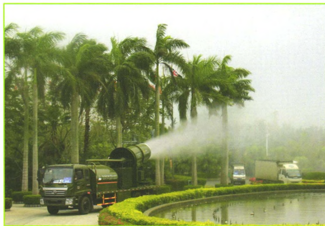
一种控制PM 2.5 空气质量超标的移动式水雾降尘机车 （专利号：201220226287.6）