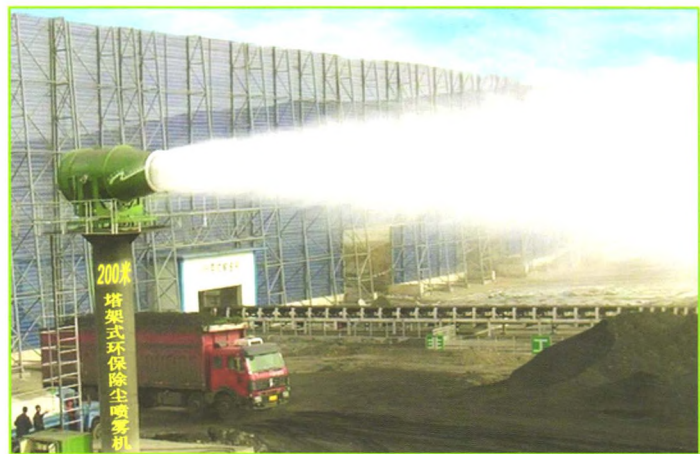
控制PM 2.5 空气质量超标的塔架式水雾降尘装置 （专利号：201220207087.6）