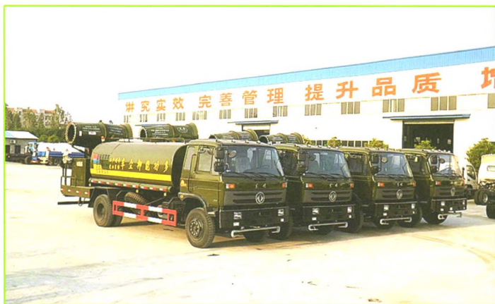
多功能喷雾抑尘车（可整车上牌）