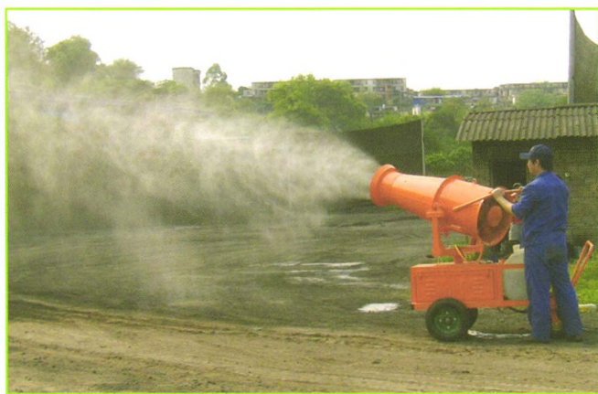
手推式环保除尘喷雾装置（小范围的喷雾降尘）