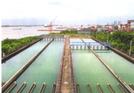
42. 对环境责任与环境权益界定的探讨