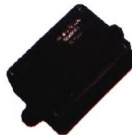
BGYC-01型 \gamma 辐射监测仪