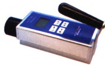
\chi 、 \gamma 吸收剂量率仪