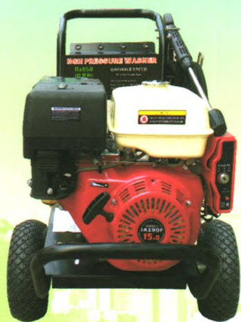
小广告高压清洗机

“巨灵神”高压清洗机/高压清洗车，在内蒙古、黑龙江、吉林、辽宁、河北、山东、山西、河南、陕西、江苏、湖北、浙江、福建、江西、湖南、四川、贵州、云南、广西、新疆、西藏、广东使用中。