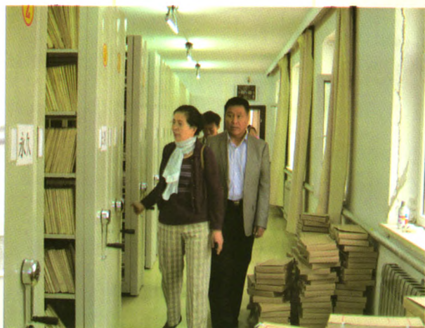
省档案局王健俐副局长检查安达市档案工作

随着档案事业的快速发展，我们要认真履行“为党管档、为国守史、为民服务”的神圣职责，积极融入经济建设主战场，为地方经济又好又快发展作出兰台人应有的贡献。