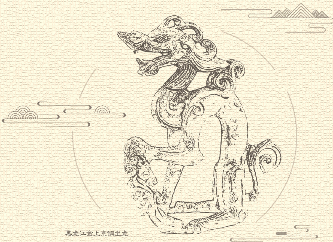
黑龙江金上京铜坐龙