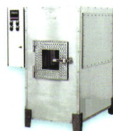
● JKLZ-4 烤炉