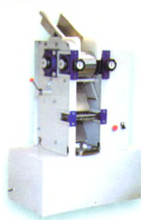
● JMTD168/140 实验面条机