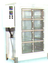
● JXFD-7 醒发箱