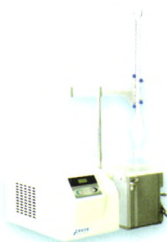
● JCPD 吹泡示功仪