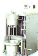
● JHMZ-200 针式和面机