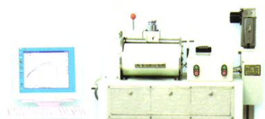
● JMLD 面团拉伸仪