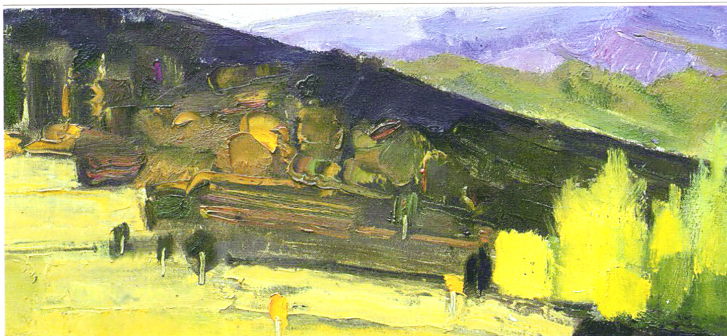
《深秋之恋》/ Love in the Late Autumn